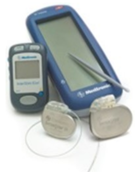
Afstandsbediening behorende bij de inwendige pacemaker

Een vervelende complicatie die kan ontstaan is het verschuiven van de elektrode. Wanneer de elektrode niet meer op de goede plek zit zal de procedure eventueel opnieuw moeten plaatsvinden