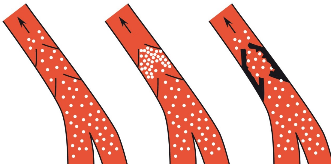
Normale bloedstroom door een ader met kleppen

Bij een syndroom zijn er allerlei klachten aanwezig die één oorzaak hebben. De oorzaak van het Post-Trombotisch Syndroom is een vernauwing in de aders van het bekken, de lies en het bovenbeen die de bloedstroom door het been belemmert. Hierdoor loopt de druk in de aders van het been op. Dit is het gevolg van een trombose been (dit kan in sommige gevallen ongemerkt voorkomen) waardoor het bloedvat is afgesloten. Door een ontstekingsreactie is de trombose deels opgelost, maar zijn er littekens ontstaan in uw vaten die zorgen voor vernauwingen.