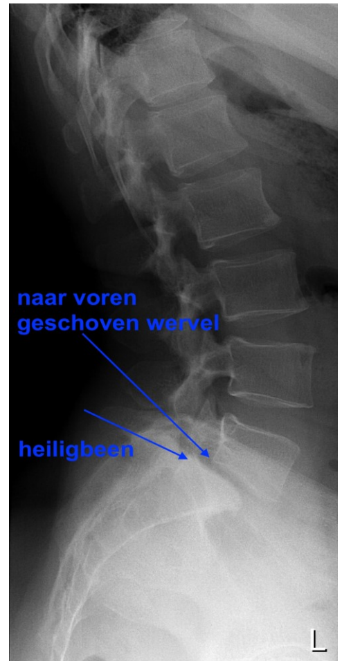
Röntgenfoto van de zijkant van de wervelkolom; te zien is dat de onderste lendenwervel naar voren is verschoven ten opzichte van het heiligbeen.

De operatie vindt plaats onder algehele narcose en duurt twee tot drie uur. Vooraf krijgt u een infuus voor de toediening van narcose en andere medicatie. Vlak voordat de operatie begint, wordt u op uw buik gelegd. Tijdens de operatie worden eerst de spieren van de wervelkolom afgeschoven. Dan worden schroeven in een aantal wervels geplaatst en wordt de wervelboog aan de achterzijde verwijderd om beknelde zenuwen vrij te leggen.