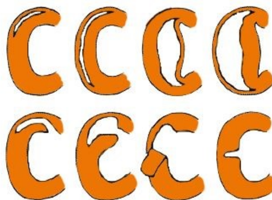
1: diverse voorbeelden van een gescheurde meniscus