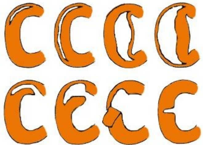
1: diverse voorbeelden van een gescheurde meniscus