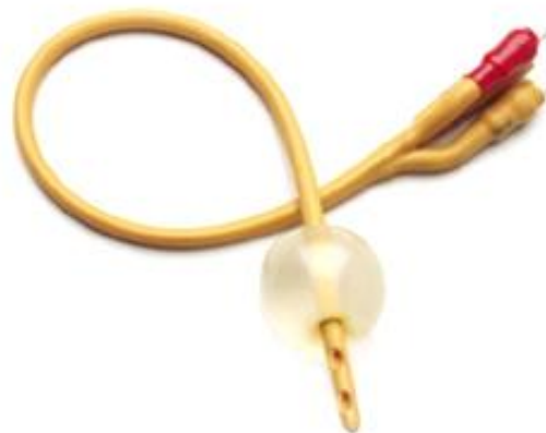
Fig. 1: Een Foley-katheter

Dit wordt ook wel 'primen' genoemd. Een methode om de baarmoedermond rijp te maken is het inbrengen van een Foley-katheter (een dun slangetje) in de baarmoedermond. In de top van dit slangetje zit een klein ballonnetje dat na het inbrengen met water wordt gevuld. Door de druk van het ballonnetje komen natuurlijke hormonen vrij die de rijping van de baarmoedermond versnellen. De Foley-katheter wordt meestal 's avonds ingebracht. U wordt 's avonds rond 19.30 uur opgenomen op de verloskamers op niveau 2.