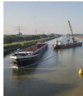
Woensdag wordt er langs het Julianakanaal gewerkt aan marifoonmasten.