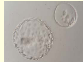
dag 6-7: blastocyst volledige hatching