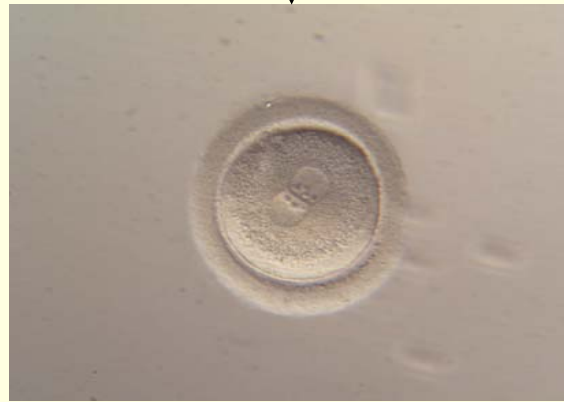
eicel is wel bevrucht (=zygote) (er zijn 2 kernen te zien, 1 mannelijke en 1 vrouwelijke)