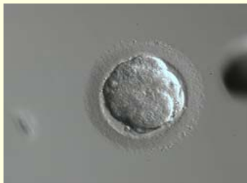
dag 5: morula (=klompje van +/- 16 cellen)