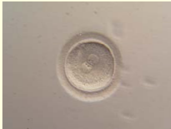
dag 1: zygote