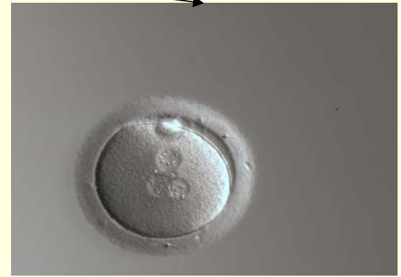
eicel is abnormaal bevrucht (er zijn 3 kernen te zien)