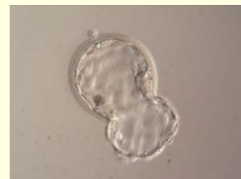
dag 6-7: hatching blastocyst