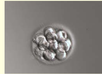
dag 4: meercellig embryo (8-16 cellen)