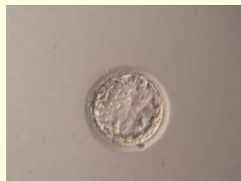
dag 6: blastocyst (+/- 40-150 cellen)