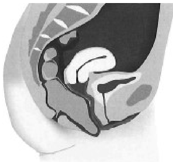
Verzakking darm (rectocele)

De operatie duurt ongeveer anderhalf uur. Als er geen complicatie optreden kunt u meestal na twee tot drie dagen weer naar huis.