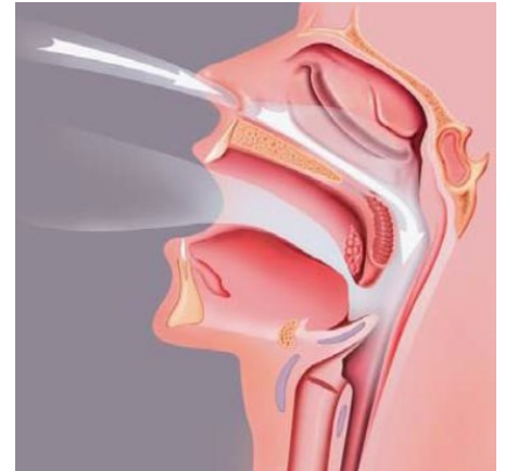
Ademhalen gaat weer zonder obstructies.

Zodra uw neusslijmvliezen weer de 'juiste' grootte hebben, is uw neus vrij en hebt u minder last van een verstopte neus.