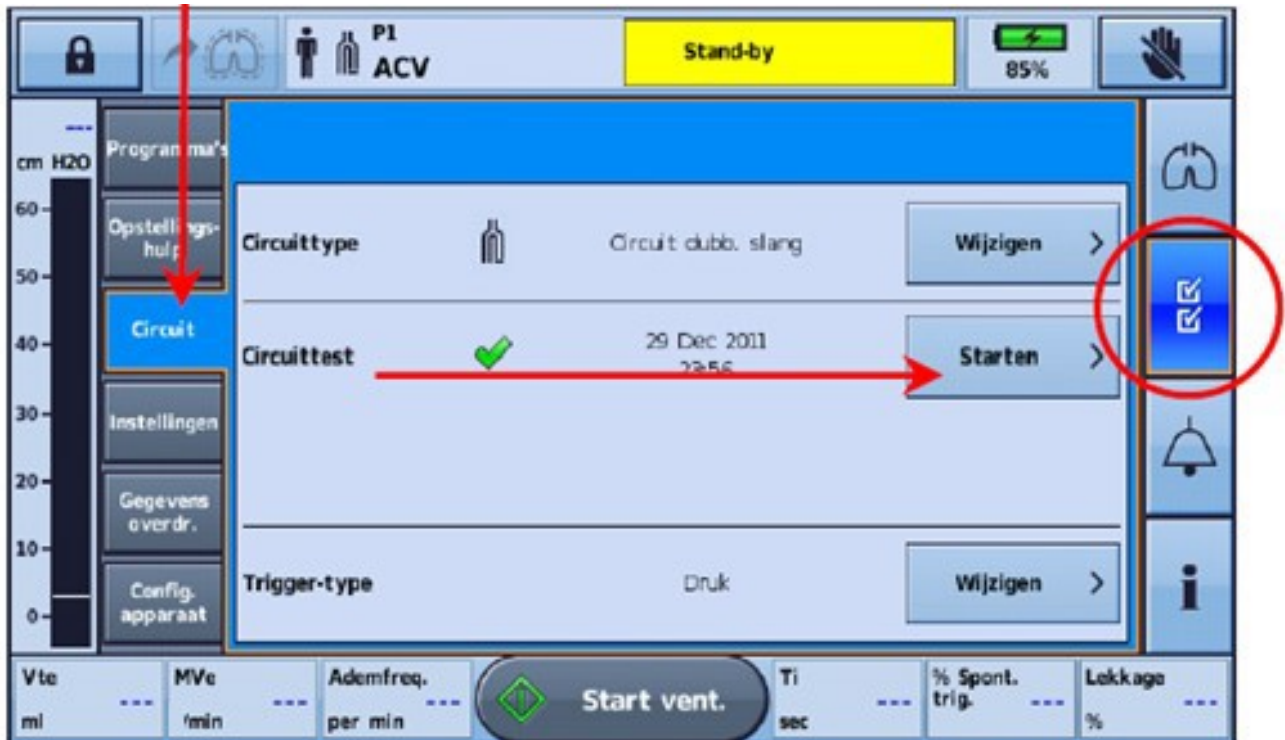
Afbeelding 4. Circuittest/slangentest