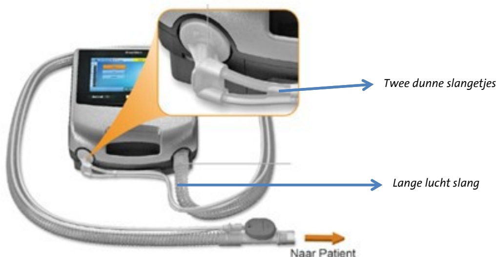
Afbeelding 3. Aansluiten van de slangen

Op het andere uiteinde van de lange slang zit een ronde grijze uitademingsklep. Op deze klep wordt de swivel aangesloten. De klep dient om de uitgeademde lucht weer naar buiten te laten via één van de twee dunne slangen. De tweede dunne slang dient om de druk in het systeem te meten.