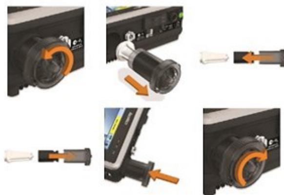
Afbeelding 5: Controle/vervanging luchtfilter