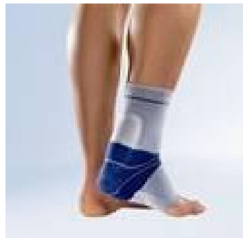
Fig. 10. de Achillotrain

Met stevige draden of ankers wordt de kuitspier opnieuw vastgemaakt aan het hielbeen.