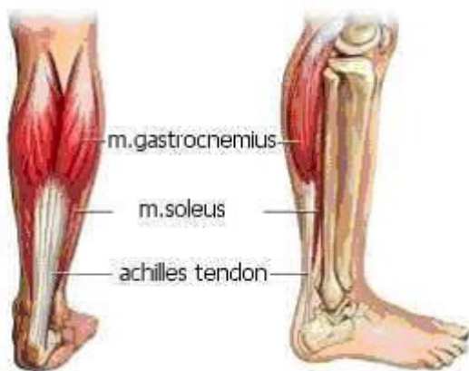
Fig. 1 Achillespees 1

Het scheuren van de achillespees gaat meestal gepaard met een plotse hevige pijn laag achter op de kuit of enkel ( figuur 2 ). U kunt bijna niet meer lopen.