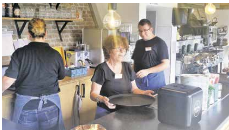
Medewerkers van Rendiz-restaurant De Ringoven in de voormalige Heldensche Steenfabriek in Panningen doen hier kostbare werkervaring op.

Werk en daardoor zinvol mee kunnen doen in de samenleving is belangrijk. Maar veel mensen zijn daar op eigen kracht niet toe in staat. Burgerkracht Limburg zoekt naar mogelijkheden om die afstand tot de arbeidsmarkt te verkleinen of te overbruggen. Daarnaast zijn er ook andere initiatieven die tot doel hebben om mensen met een achterstand mee te laten doen. Relim in Landgraaf bijvoorbeeld biedt