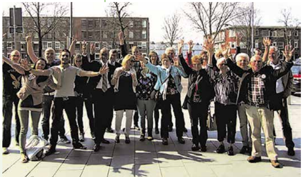
Vrijwilligers, gasten en leden van de vereniging NaoberzorgPunt Roggel.